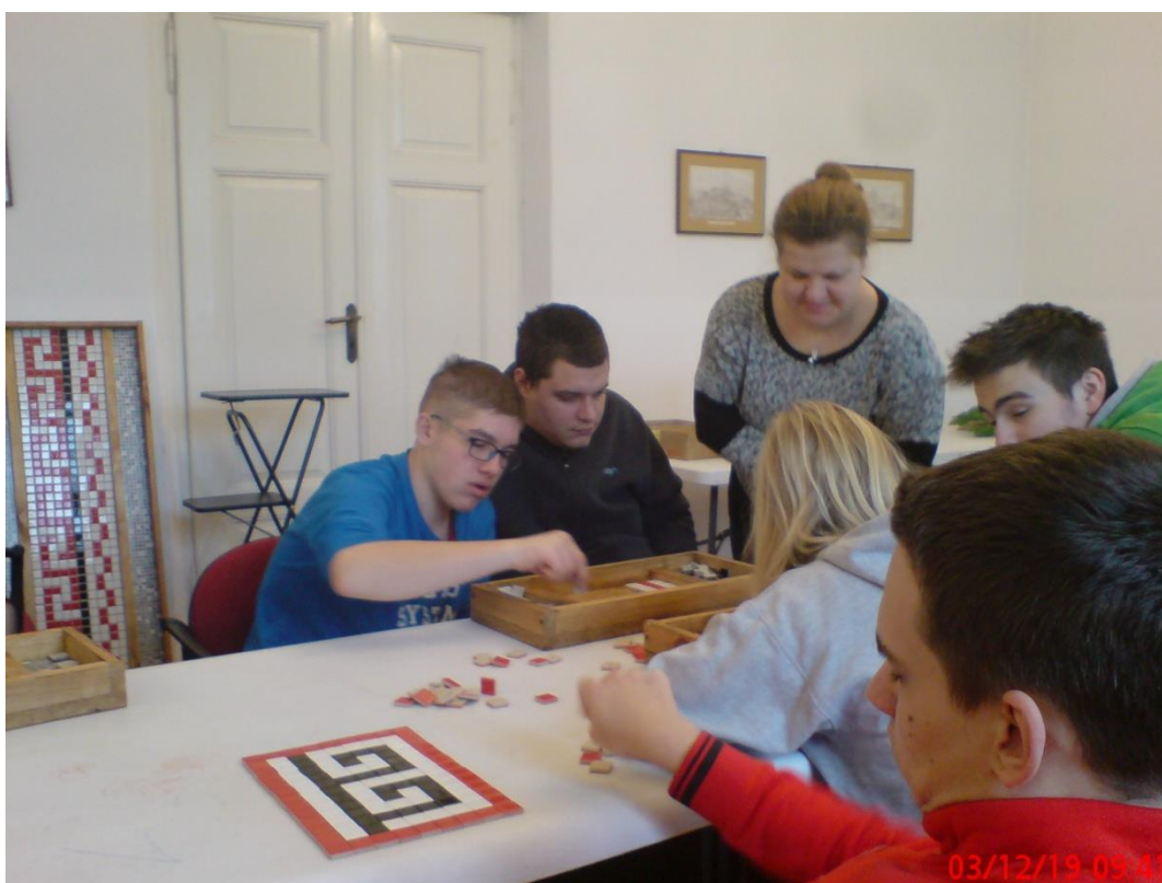
Mozaiki o motywie rzymskim stosowanym np. w ogrodach wodnych